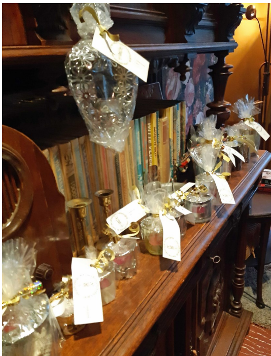
Die wedstrijd gaat natuurlijk wel ergens om! Een lichtgevende prijzenkast!