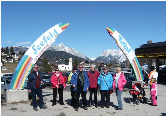
De jaarlijkse wintersport in Seefeld (2008).